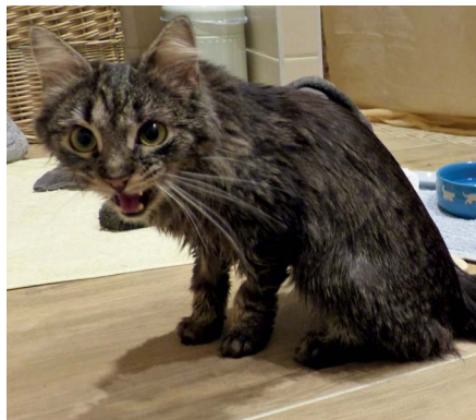
24 feb 2020 - 10 dagen in behandeling. 10 e portie capsules achter de kiezen...

Aanvankelijk durfde ik letterlijk mijn ogen niet te geloven toen ik zag hoe Pebbles vanaf de eerste behandeldag al opknapt. Amper twaalf uur na de eerste dosis medicijn liep ze weer met iets rechttere poten. Eerst dacht ik dat ik het niet goed zag, dat ik alleen maar zag wat ik wilde zien. Pas toen Pebbles even later heel